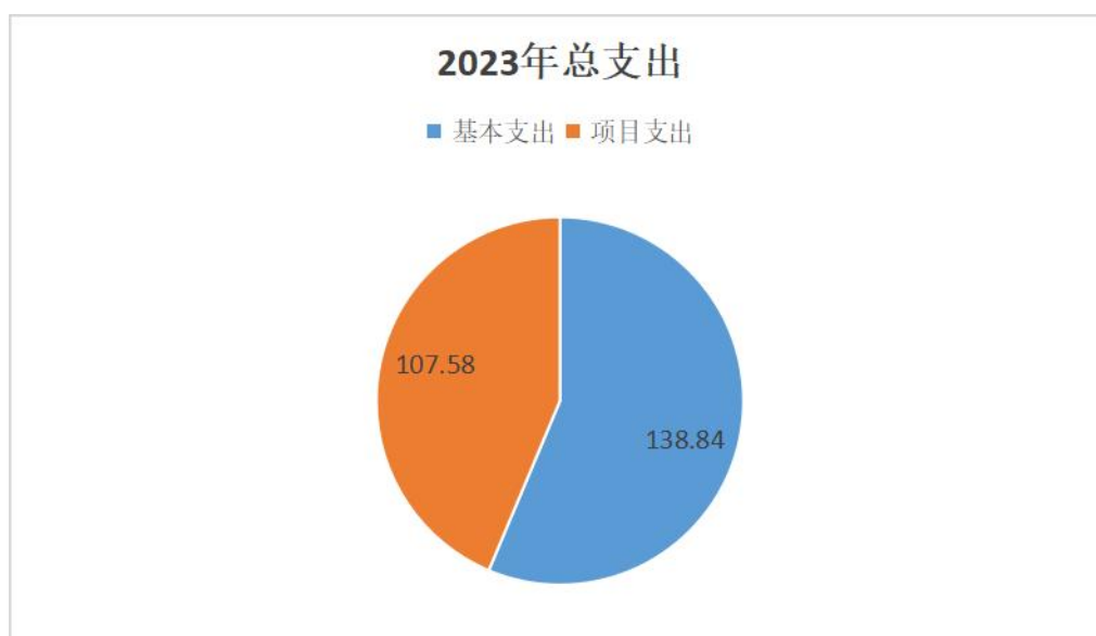
图 2. 支出决算图